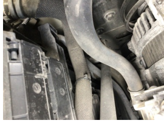
İlave parçalar, ön, Ön koruma demiri - bağlantı ayağı > Değişmiş