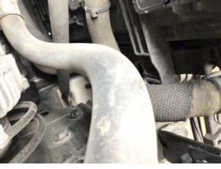
İlave parçalar, ön, Ön koruma demiri > Değişmiş