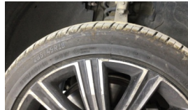
Jant, sağ ön > Çizik