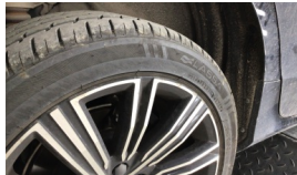
Jant, sağ arka > Çizik