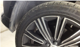
Jant, sol ön > Çizik