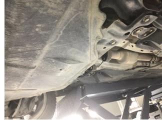
Motor, Alt muhafaza > Sabitlemesi Hatalı