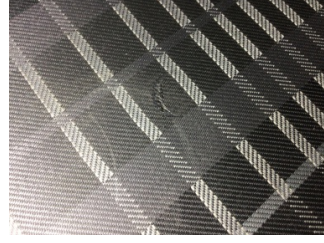
Koltuklar, ön, Koltuk, sol ön > Yakıcı Madde Ile Zarar Görmüş