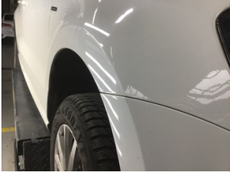
Çamurluk, sağ, Çamurluk, sağ > Noktasal Ezik