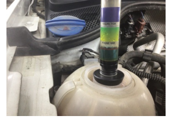
Motor, Silindir kapağı contası > Test Sonucu