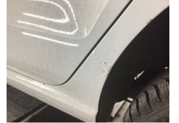
Çamurluk, sol arka, Çamurluk ağız > Pas