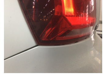
Tampon, arka, Arka tampon > Ayarsız