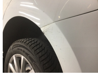
Tampon, arka, Arka tampon > Boyası Atmış