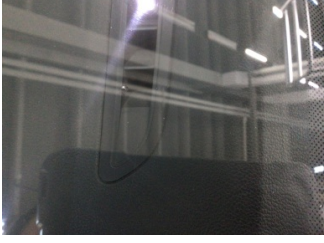
Camlar, Ön cam > Taş Lzi

Sayfa: 1/1 Araç Çıkış Tarihi: 21.11.2024 16:32