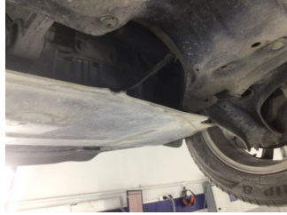
Motor, Alt muhafaza > Sabitlemesi Hatalı