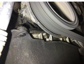
Motor, Yağ karteri > Yağ Kaçağı