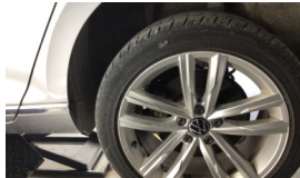
Jant, sol arka > Çizik