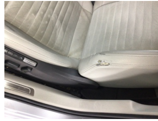
Koltuklar, ön, Koltuk, sol ön > Deforme Olmuş