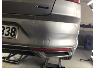
Tampon, arka, Arka tampon > Ezik