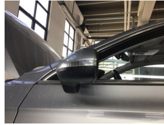
Dikiz aynası, sol, Dış dikiz aynası > Çizik