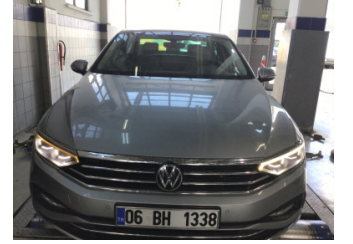
Motor kaputu, Motor kaputu > Dolu Hasarı