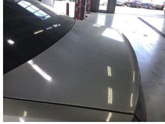
Bagaj kapağı/kapısı, Bagaj kapısı > Noktasal Ezik