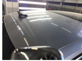
Tavan, Tavan > Dolu Hasarı