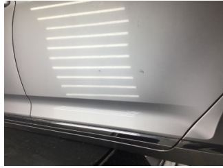
Kapı, sol arka, Kapı, sol arka > Çizik