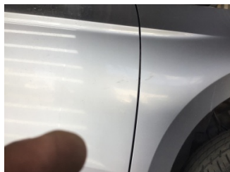
Kapı, sağ ön, Kapı, sağ ön > Noktasal Ezik