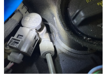
Motor, Yakıt sistemi > Sızdırıyor