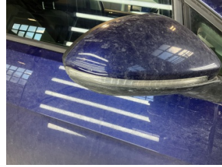
Dikiz aynası, sağ, Dış dikiz aynası kapağı > Çizik