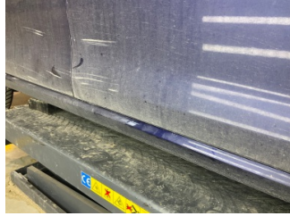
Kapı, sağ ön, Kapı, sağ ön > Hasarlı