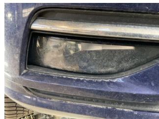
Sis lambaları, Sis farı camı, sağ > Hasarlı