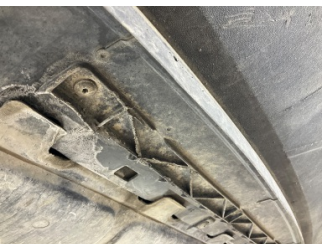
Tampon, ön, Tampon koruyucu orta > Hasarlı