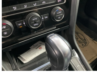
Şanzıman, Vites topuzu > Deforme Olmuş