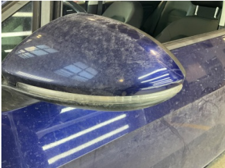
Dikiz aynası, sol, Dış dikiz aynası kapağı > Çizik