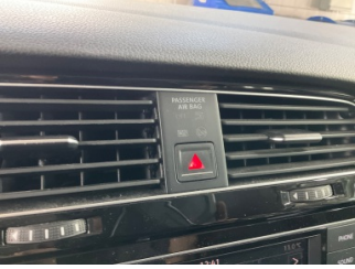
Pano/Göstergeler, Ön pano düğmeleri > Hasarlı