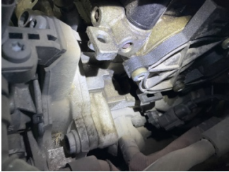
Motor, Motor > Yağ Kaçağı