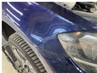
Tampon, ön, Ön tampon > Sabitlemesi Hatalı