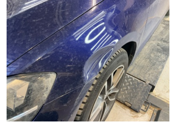
Çamurluk, sol, Çamurluk, sol > Hasarlı