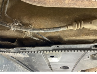
Kaporta, Muhafaza, orta > Ezik