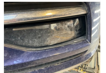
Sis lambaları, Sis farı camı, sol > Hasarlı