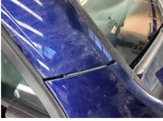
Kaporta, A-direk, sağ > Boyası Atmış

Sayfa: 9/10 Araç Çıkış Tarihi: 14.04.2025 12:50