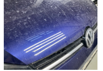
Motor kaputu, Motor kaputu > Taş izi