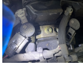
Motor, Yakıt sistemi > Sızdırıyor