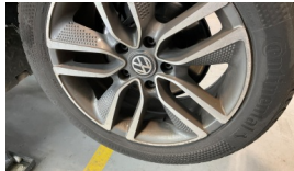
Jant, sol arka > Çizik