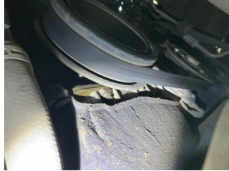
Motor, Motor > Yağ Kaçağı