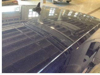
Tavan, Tavan > Yakıcı Madde ile Zarar Görmüş