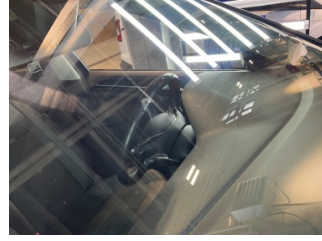
Camlar, Ön cam > Taş izi