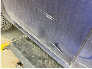
Kapı, sağ arka, Kapı, sağ arka > Hasarlı