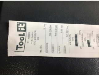
Elektrik donanımı/Pano, Akü > Test Sonucu