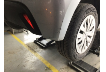
Tampon, arka, Arka tampon > Çizik