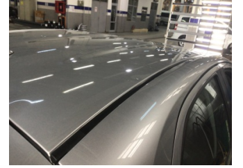
Tavan, Tavan > Noktasal Ezik