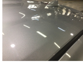
Tavan, Tavan > Noktasal Ezik