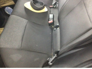
Koltuklar, arka, Arka koltuk > Kirlenmiş