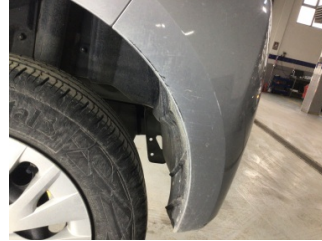
Tampon, arka, Arka tampon > Çizik