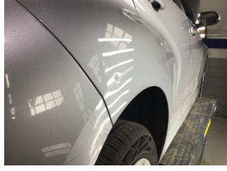
Çamurluk, sağ arka, Çamurluk, sağ arka > Ezik