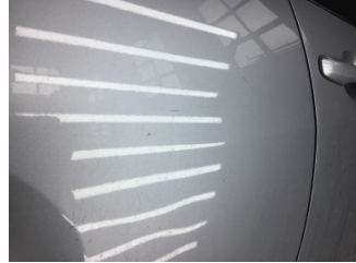
Kapı, sağ arka, Kapı, sağ arka > Çizik