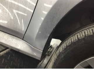
Çamurluk, sağ, Çamurluk, sağ > Ezik