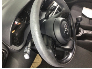
Direksiyon sistemi, Direksiyon simidi > Deforme Olmuş