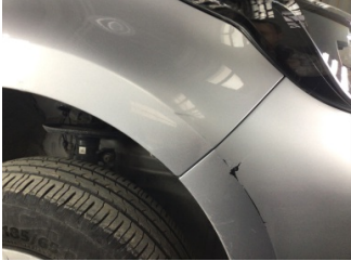
Çamurluk, sağ, Çamurluk, sağ > Çizik