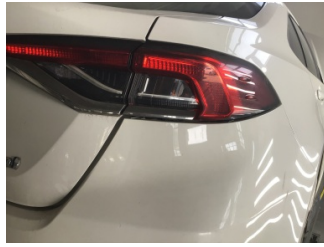
Tampon, arka, Arka tampon > Ayarsız