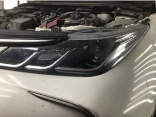
Farlar, Far camı, sol > Çizik