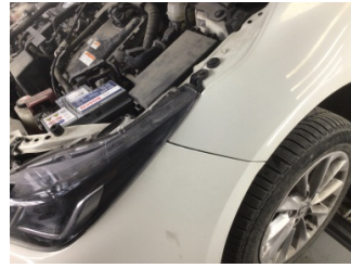
Tampon, ön, Ön tampon > Ayarsız