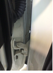
Kapı, sol ön, Kapı, sol ön > Ezik