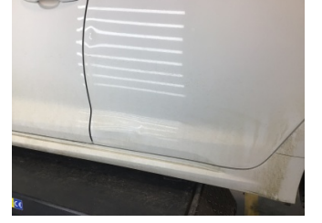
Kapı, sol arka, Kapı, sol arka > Ezik