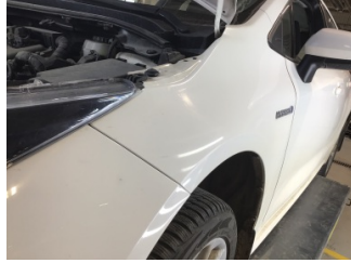
Çamurluk, sol, Çamurluk, sol > Çizik