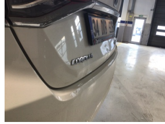
Bagaj kapağı/kapısı, Bagaj kapısı > Hasarlı