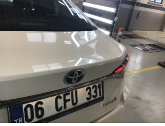
Bagaj kapağı/kapısı, Bagaj kapısı > Noktasal Ezik