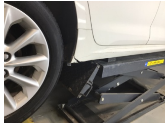
Marşbiyel, sağ, Marşbiyel plastiği, sağ > Hasarlı