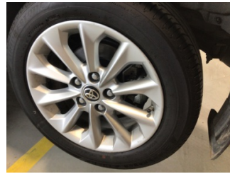
Çamurluk, sol arka, Çamurluk ağızı > Noktasal Ezik