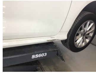
Marşbiyel, sağ, Marşbiyel plastiği, sağ > Hasarlı