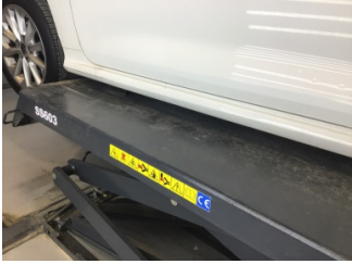
Marşbiyel, sol, Marşbiyel plastiği, sol > Çizik