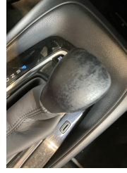
Şanzıman, Vites topuzu > Deforme Olmuş