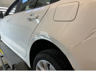
Çamurluk, sol arka, Çamurluk, sol arka > Hasarlı