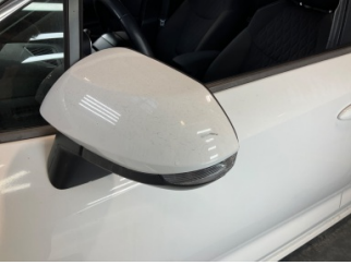
Dikiz aynası, sol, Dış dikiz aynası > Çizik