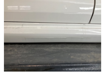
Marşbiyel, sağ, Marşbiyel plastiği, sağ > Hasarlı