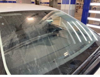
Camlar, Ön cam > Taş izi