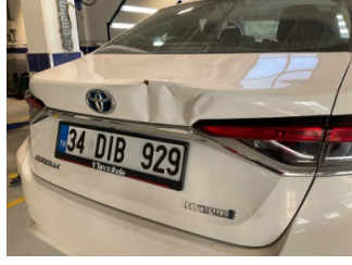
Bagaj kapağı/kapısı, Bagaj kapısı > Hasarlı