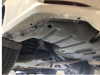
Tampon, arka, Arka tampon > Hatalı Ayarlanmış