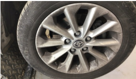
Jant, sağ ön > Çizik