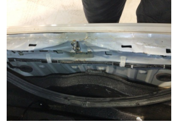
Arka bölüm, Arka sac/panel > Hasarlı