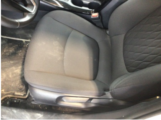
Koltuklar, ön, Koltuk, sol ön > Kirlenmiş