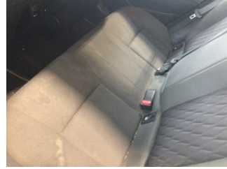
Koltuklar, arka, Arka koltuk > Kirlenmiş