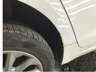
Çamurluk, sağ arka, Çamurluk, sağ arka > Boyası Atmış