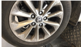
Jant, sol ön > Çizik