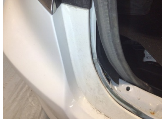
Arka bölüm, Arka sac/panel > Hasarlı