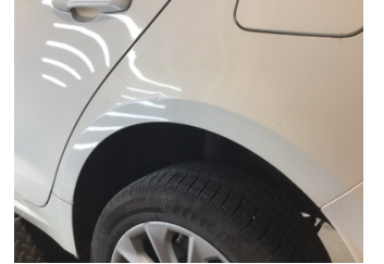
Çamurluk, sol arka, Çamurluk, sol arka > Noktasal Ezik