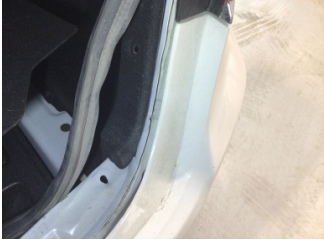
Arka bölüm, Arka sac/panel > Hasarlı