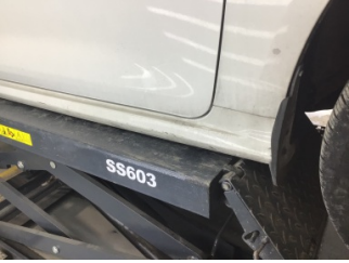
Marşbiyel, sağ, Marşbiyel plastiği, sağ > Çizik