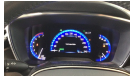
Tekerlek/Lastik > Uyarı Lambası Yanıyor