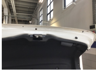
Bagaj kapağı/kapısı, Bagaj kapısı > Hasarlı