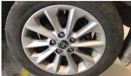
Jant, sol arka > Çizik