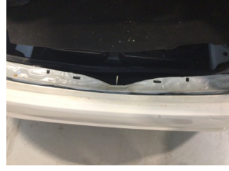
Arka bölüm, Arka sac/panel > Hasarlı