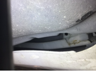
Arka bölüm, Römork çeki demiri > Ezik