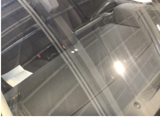
Camlar, Ön cam > Taş izi

Sayfa: 10/11 Araç Çıkış Tarihi: 22.01.2025 15:11