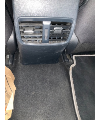
Kalorifer/Klima, Havalandırma ızgarası > Hasarlı