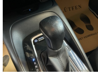
Şanzıman, Vites topuzu > Deforme Olmuş