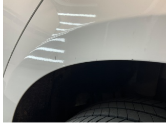
Çamurluk, sol arka, Çamurluk, sol arka > Çizik