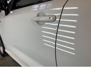
Kapı, sol ön, Kapı, sol ön > Ezik