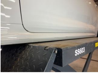
Marşbiyel, sol, Marşbiyel plastiği, sol > Çizik