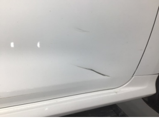
Kapı, sağ ön, Kapı, sağ ön > Ezik