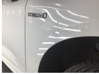
Çamurluk, sağ, Çamurluk, sağ > Noktasal Ezik