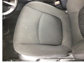
Koltuklar, ön, Koltuk, sol ön > Kirlenmiş