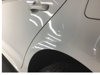
Çamurluk, sol arka, Çamurluk, sol arka > Ezik