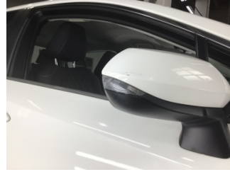
Dikiz aynası, sağ, Dış dikiz aynası > Çizik