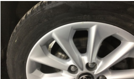
Jant, sağ ön > Çizik