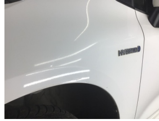
Çamurluk, sol, Çamurluk, sol > Noktasal Ezik