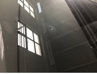
Camlar, Ön cam > Taş Izı