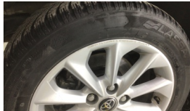
Jant, sağ arka > Çizik