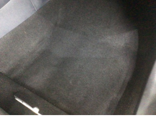
Taban, Paspaslar > Sökülmüş-Yok