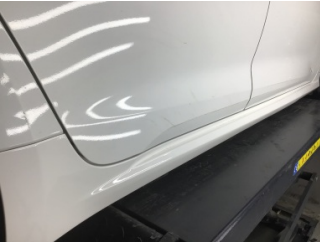
Kapı, sağ arka, Kapı, sağ arka > Çizik