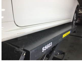
Marşbiyel, sol, Marşbiyel plastiği, sol > Çizik