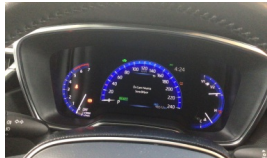
Tekerlek/Lastik > Uyarı Lambası Yanıyor