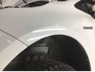
Çamurluk, sol, Çamurluk, sol > Çizik