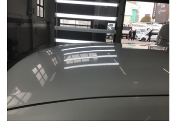
Tavan, Tavan > Noktasal Ezik