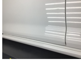
Kapı, sol ön, Kapı, sol ön > Ezik