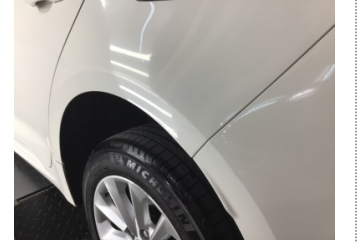
Çamurluk, sol arka, Çamurluk, sol arka > Çizik