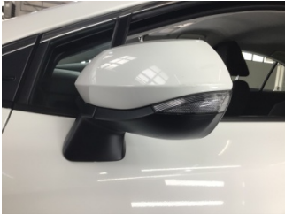
Dikiz aynası, sol, Dış dikiz aynası > Çizik