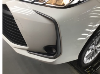
Tampon, ön, Ön tampon > Çizik