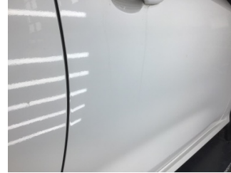
Kapı, sağ ön, Kapı, sağ ön > Noktasal Ezik