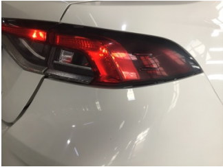
Tampon, arka, Arka tampon > Ayarsız