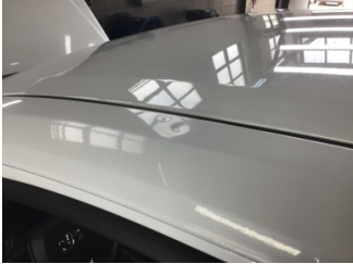
Tavan, Sol üst frangart > Noktasal Ezik