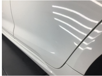
Kapı, sol arka, Kapı, sol arka > Noktasal Ezik