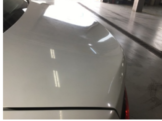
Bagaj kapağı/kapısı, Bagaj kapısı > Yakıcı Madde ile Zarar Görmüş