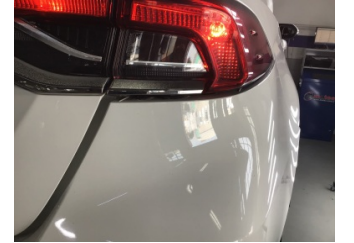
Tampon, arka, Arka tampon > Ayarsız