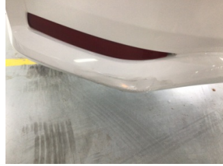
Tampon, arka, Arka tampon > Çizik