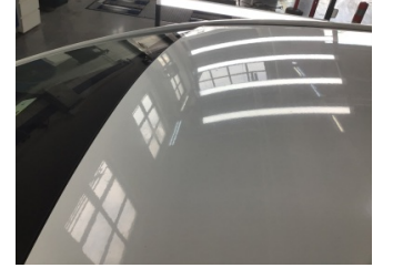
Tavan, Tavan > Yakıcı Madde ile Zarar Görmüş