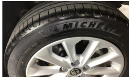
Jant, sol arka > Çizik