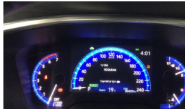
Tekerlek/Lastik > Uyarı Lambası Yanıyor