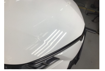
Motor kaputu, Motor kaputu > Taş izi