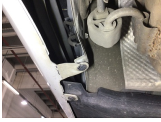
Tampon, arka, Bağlantı ayağı > Ezik