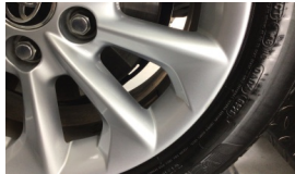
Jant, sağ ön > Çizik