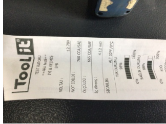
Elektrik donanımı/Pano, Akü > Test Sonucu