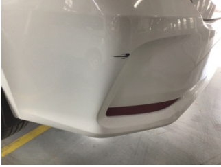
Tampon, arka, Arka tampon > Çizik