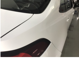
Çamurluk, sağ arka, Çamurluk, sağ arka > Ezik