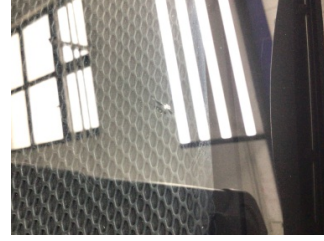
Camlar, Ön cam > Taş Vuruğu