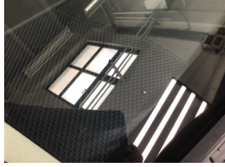
Camlar, Ön cam > Taş Vuruğu