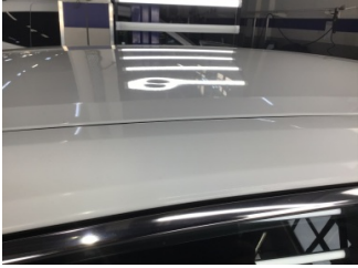
Tavan, Tavan > Noktasal Ezik