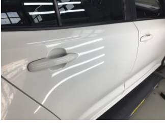
Kapı, sağ arka, Kapı, sağ arka > Noktasal Ezik

Sayfa: 1/1 Araç Çıkış Tarihi: 02.11.2024 14:20