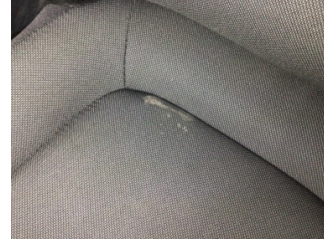
Koltuklar, ön, Koltuk, sol ön > Deforme Olmuş