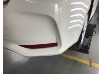
Tampon, arka, Arka tampon > Çizik