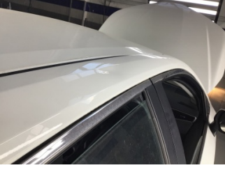
Tavan, Sağ üst frangart > Ezik