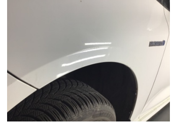
Çamurluk, sol, Çamurluk, sol > Çizik