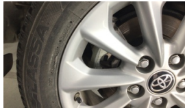
Jant, sağ arka > Çizik