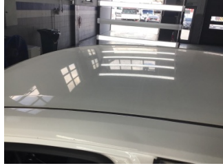
Tavan, Tavan > Dolu Hasarı