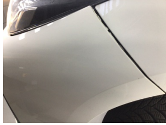
Tampon, ön, Ön tampon > Ayarsız