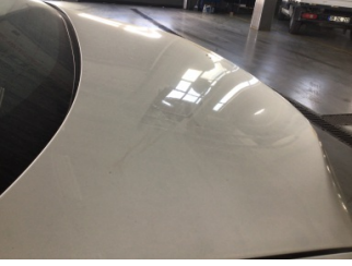
Bagaj kapağı/kapısı, Bagaj kapısı > Noktasal Ezik