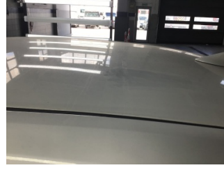
Tavan, Tavan > Ezik