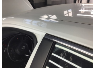
Tavan, Sol üst frangart > Ezik