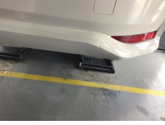
Tampon, arka, Arka tampon > Ezik