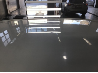
Tavan, Tavan > Noktasal Ezik