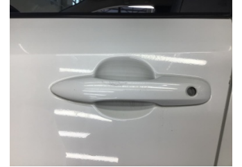
Kapı, sol ön, Kapı kolu, dış > Çizik