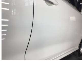
Kapı, sağ ön, Kapı, sağ ön > Noktasal Ezik