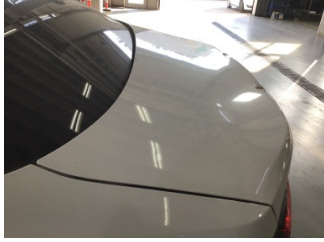
Bagaj kapağı/kapısı, Bagaj kapısı > Dolu Hasarı