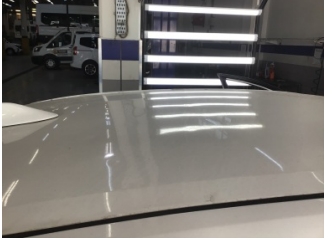
Tavan, Tavan > Hasarlı