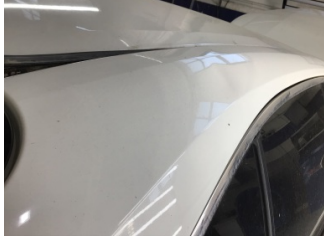
Tavan, Sağ üst frangart > Ezik