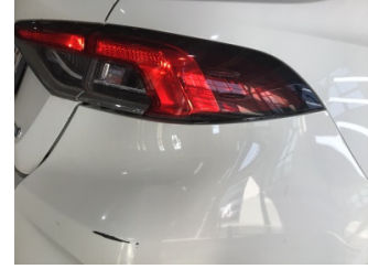
Tampon, arka, Bağlantı ayağı > Ayarsız