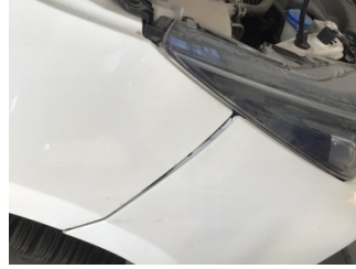
Tampon, ön, Ön tampon > Ayarsız