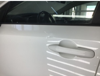
Kapı, sol ön, Kapı, sol ön > Noktasal Ezik