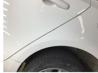
Çamurluk, sol arka, Çamurluk, sol arka > Çizik