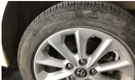
Jant, sol arka > Çizik