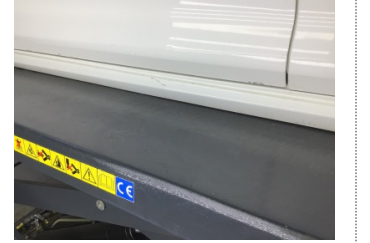
Marşbiyel, sol, Marşbiyel plastiği, sol > Çizik