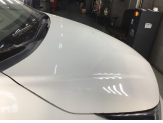
Motor kaputu, Motor kaputu > Dolu Hasarı