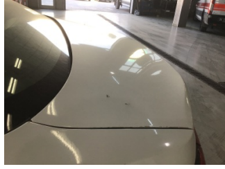
Bagaj kapağı/kapısı, Bagaj kapısı > Dolu Hasarı