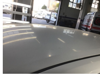
Tavan, Tavan > Dolu Hasarı