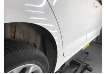
Çamurluk, sağ arka, Çamurluk, sağ arka > Noktasal Ezik