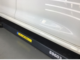
Marşbiyel, sağ, Marşbiyel plastiği, sağ > Çizik