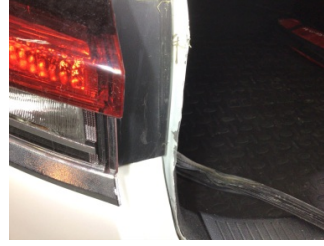
Arka bölüm, Arka sac/panel > Hasarlı