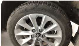
Jant, sol arka > Çizik