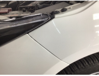
Farlar, Far, sol > Ayarsız