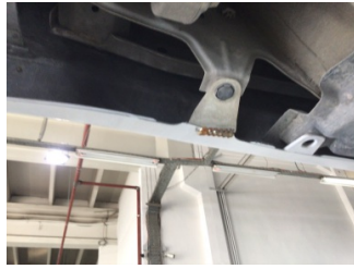
Tampon, arka, Bağlantı ayağı > Hasarlı