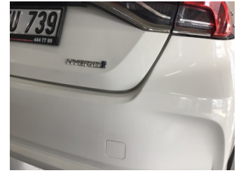
Bagaj kapağı/kapısı, Bagaj kapısı > Ayarsız