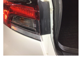
Arka bölüm, Arka sac/panel > Hasarlı