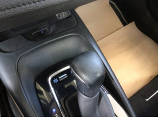
Şanzıman, Vites topuzu > Deforme Olmuş