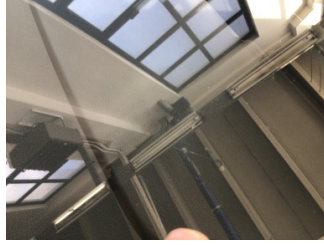
Camlar, Ön cam > Taş izi