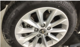
Jant, sağ arka > Çizik