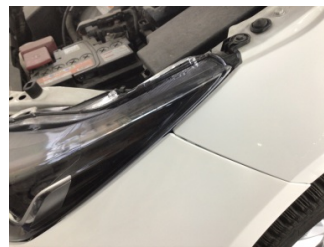
Tampon, ön, Ön tampon > Ayarsız