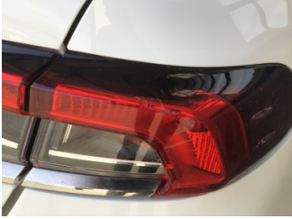
Arka lambalar, Arka lambalar, sağ > Çizik