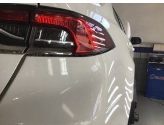
Tampon, arka, Arka tampon > Ayarsız