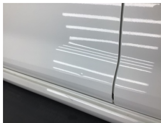
Kapı, sol ön, Kapı, sol ön > Noktasal Ezik