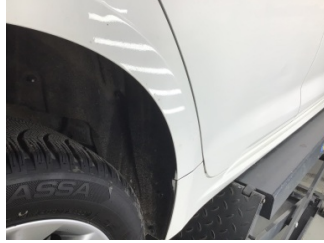
Çamurluk, sağ arka, Çamurluk, sağ arka > Çizik