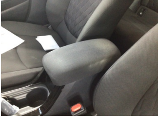
Döşemeler/Kapaklar, Döşemeler/Kapaklar > Deforme Olmuş