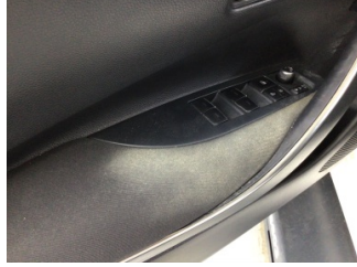
Döşemeler/Kapaklar, Döşemeler/Kapaklar > Deforme Olmuş