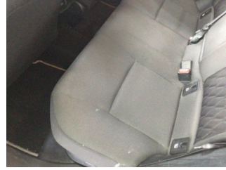
Döşemeler/Kapaklar, Döşemeler/Kapaklar > Kirlenmiş