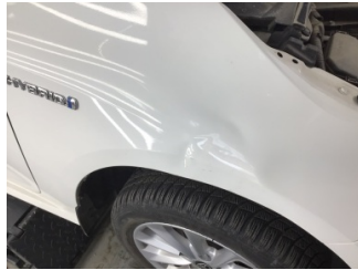
Çamurluk, sağ, Çamurluk, sağ > Hasarlı