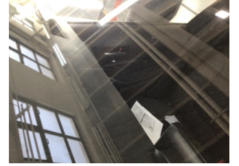
Camlar, Ön cam > Taş Vuruğu