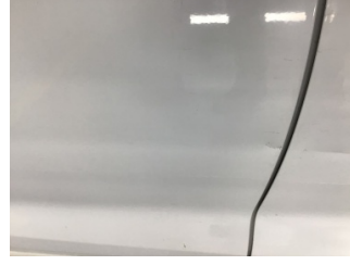
Kapı, sağ arka, Kapı, sağ arka > Ezik