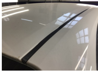
Tavan, Port bagaj demiri > Ezik