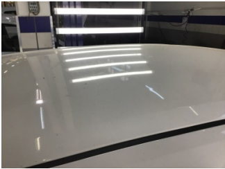
Tavan, Tavan > Dolu Hasarı