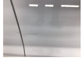
Kapı, sağ ön, Kapı, sağ > Ezik