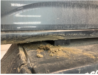
Marşbiyel, sol, Marşbiyel, sol > Hasarlı