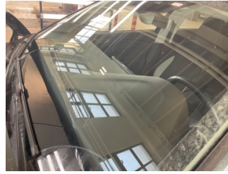
Camlar, Ön cam > Taş izi