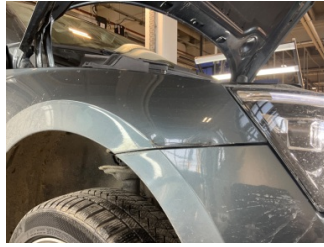
Çamurluk, sağ, Çamurluk, sağ > Hasarlı