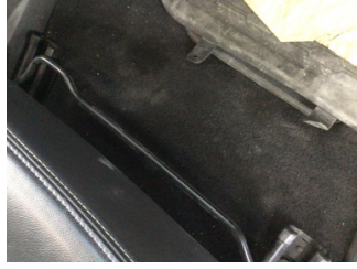
Taban, Taban halısı > Kirlenmiş