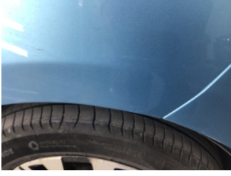
Çamurluk, sol arka, Çamurluk, sol arka > Ezik