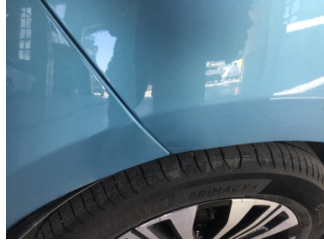
Çamurluk, sağ arka, Çamurluk, sağ arka > Ezik