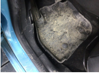
Taban, Taban halısı > Kirlenmiş