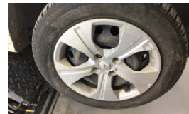
Jant kapağı seti > Deforme Olmuş