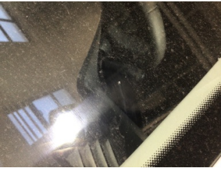
Camlar, Ön cam > Taş İzi