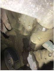
Motor, Triger zinciri > Yağ Kaçağı