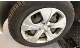
Jant kapağı seti > Deforme Olmuş