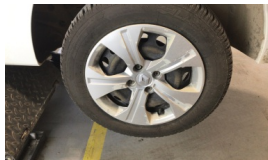
Jant kapağı seti > Deforme Olmuş