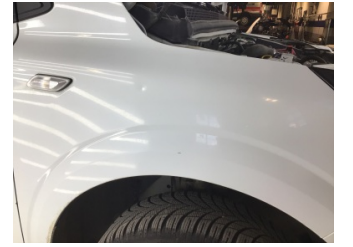
Çamurluk, sağ, Çamurluk, sağ > Noktasal Ezik