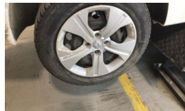
Jant kapağı seti > Deforme Olmuş