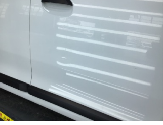
Kapı, sağ ön, Kapı, sağ ön > Ezik