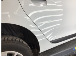
Kapı, sağ arka, Kapı, sağ arka > Ezik