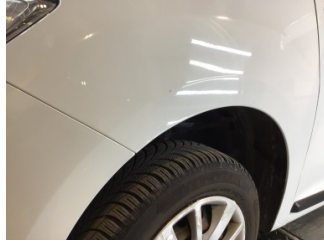
Çamurluk, sol, Çamurluk, sol > Çizik