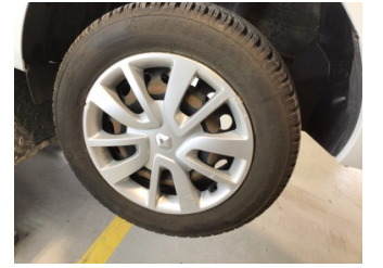
Tampon, ön, Ön tampon > Boyalı