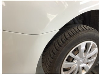
Tampon, arka, Arka tampon > Ayarsız