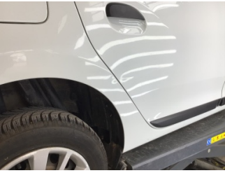
Çamurluk, sağ arka, Çamurluk ağı > Noktasal Ezik