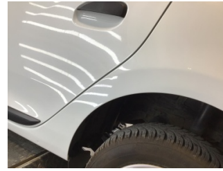
Çamurluk, sol arka, Çamurluk ağı > Noktasal Ezik