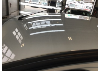
Tavan, Tavan > Noktasal Ezik