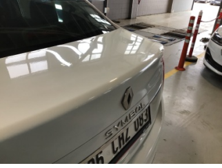
Bagaj kapağı/kapısı, Bagaj kapısı > Noktasal Ezik