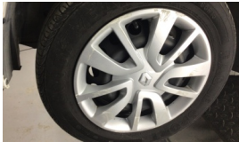
Jant kapağı seti > Hasarlı