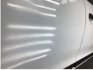
Kapı, sağ arka, Kapı, sağ arka > Çizik