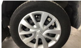
Jant kapağı seti > Hasarlı