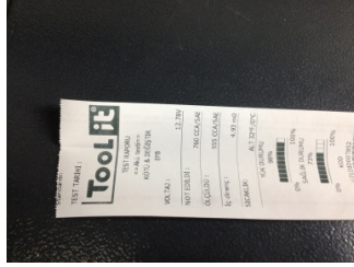
Elektrik donanımı/Pano, Akü > Test Sonucu