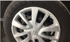
Jant kapağı seti > Hasarlı