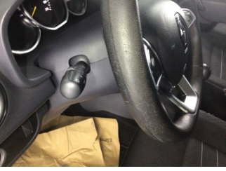
Direksiyon sistemi, Direksiyon simidi > Deforme Olmuş