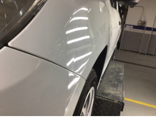
Çamurluk, sol, Çamurluk, sol > Küçük Vuruk