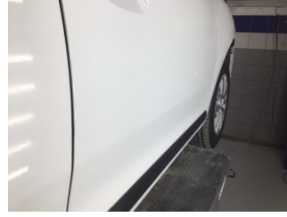
Kapı, sağ ön, Kapı, sağ ön > Noktasal Ezik