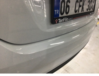
Tampon, arka, Arka tampon > Ezik