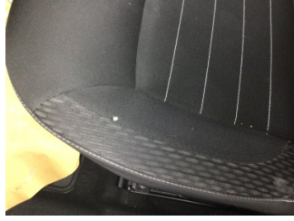
Koltuklar, ön, Koltuk, sol ön > Yakıcı Madde Ile Zarar Görmüş