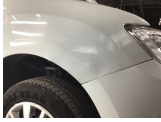
Çamurluk, sağ, Çamurluk, sağ > Ezik