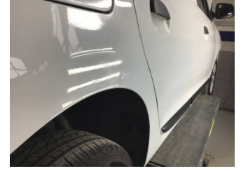
Çamurluk, sağ arka, Çamurluk, sağ arka > Noktasal Ezik