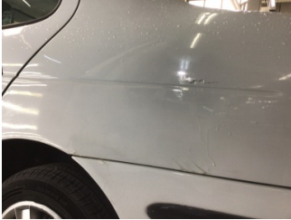
Çamurluk, sol arka, Çamurluk, sol arka > Boyası Atmış