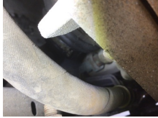
Şanzıman, Diferansiyel, ön aks > Yağ Kaçağı