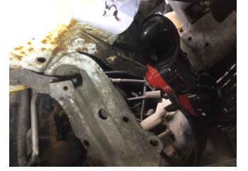
Kaporta, Sol Ön Şase > Standart Dışı Onarım