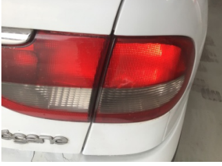
Arka lambalar, Arka lambalar, sağ > Hasarlı

Sayfa: 11/12 Araç Çıkış Tarihi: 24.05.2024 10:49