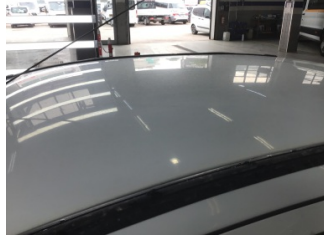
Tavan, Tavan > Dolu Hasarlı