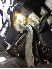
Kaporta, Ön Panel > Hasarlı