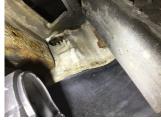
Kaporta, Sağ Podye Sacı > Hasarlı