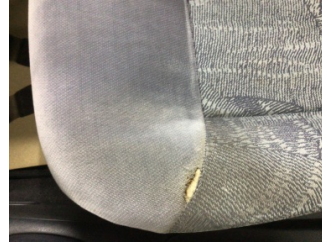
Koltuklar, ön, Koltuk, sağ ön > Deforme Olmuş