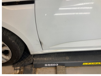
Kapı, sol ön, Kapı, sol ön > Hasarlı