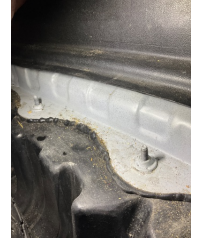
Arka bölüm, Bagaj havuzu > Hasarlı