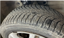
Tekerlek seti > Deforme Olmuş