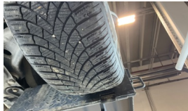
Tekerlek seti > Deforme Olmuş