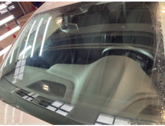
Camlar, Ön cam > Taş izi