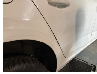
Çamurluk, sağ arka, Çamurluk, sağ arka > Hasarlı