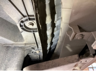
Arka bölüm, Arka sac/panel > Boyalı