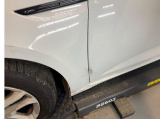
Çamurluk, sol, Çamurluk, sol > Hasarlı