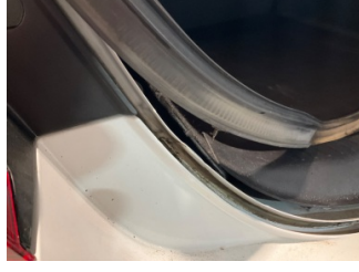
Arka bölüm, Arka sac/panel > Ezik