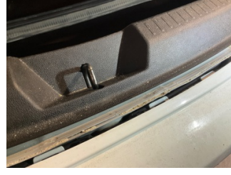
Arka bölüm, Arka sac/panel > Ezik