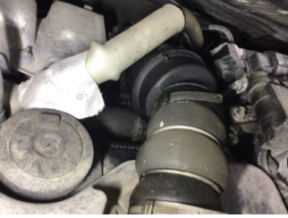
Motor, Turbo hortumları > Yağ Kaçağı