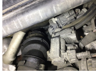
Motor, Turbo hortumları > Yağ Kaçağı