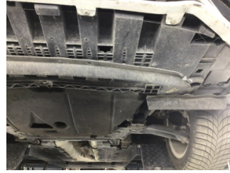
Tampon, ön, Spoiler > Hasarlı