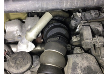
Motor, Turbo hortumları > Yağ Kaçağı