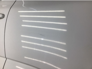
Kapı, sol arka, Kapı, sol arka > Çizik