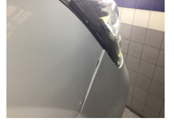
Tampon, ön, Ön tampon > Ayarsız