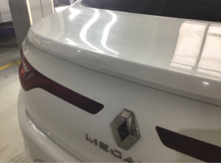
Bagaj kapağı/kapısı, Bagaj kapısı > Standart Dışı Onarım