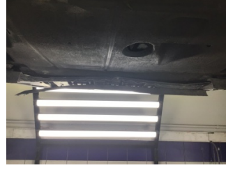
İlave parçalar, ön, Ön koruma demiri - bağlantı ayağı > Ezik