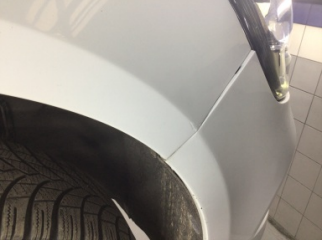
Çamurluk, sağ, Çamurluk, sağ > Çizik