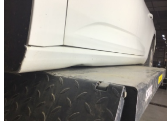
Marşbiyel, sol, Marşbiyel, sol > Ezik