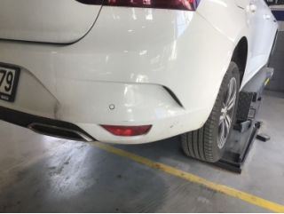
Tampon, arka, Arka tampon > Çizik