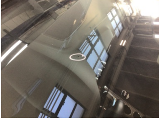
Camlar, Ön cam > Taş Vuruğu