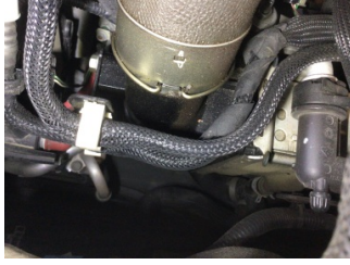
Motor, Turbo hava soğutucusu > Yağ Kaçağı