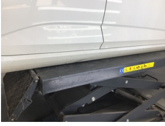
Marşbiyel, sağ, Marşbiyel, sağ > Ezik