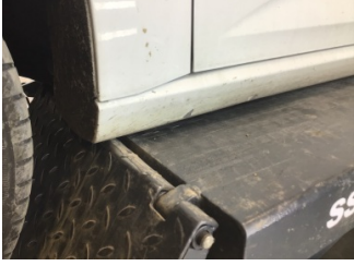
Marşbiyel, sol, Marşbiyel, sol > Boyası Atmış