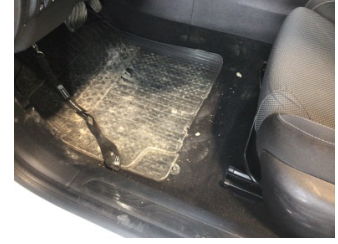
Taban, Taban halısı > Kirlenmiş