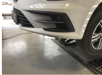
Tampon, ön, Ön tampon > Çizik