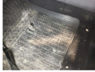
Taban, Paspaslar > Deforme Olmuş