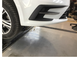
Tampon, ön, Ön tampon > Çizik