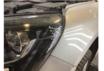
Çamurluk, sol, Çamurluk, sol > Çizik