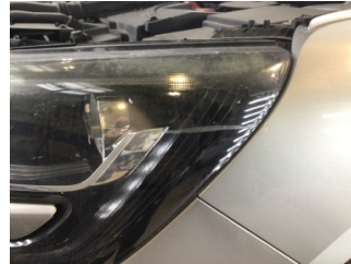
Farlar, Far camı, sol > Çizik