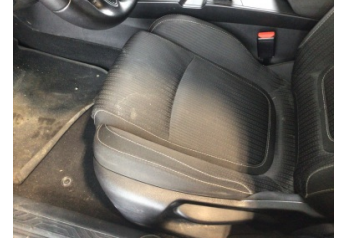
Koltuklar, ön, Koltuk, sol ön > Kirlenmiş