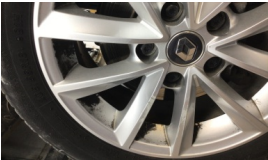
Jant, sağ ön > Çizik