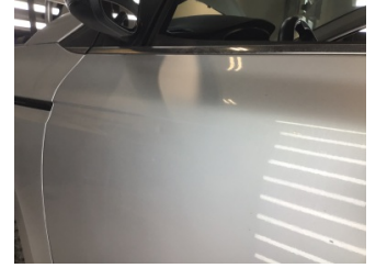
Kapı, sol ön, Kapı, sol ön > Noktasal Ezik