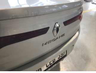
Bagaj kapağı/kapısı, Kilit mekanizması > Çalışmıyor