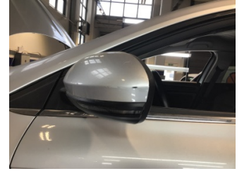
Dikiz aynası, sol, Dış dikiz aynası > Çizik