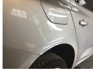
Çamurluk, sağ arka, Çamurluk ağı > Noktasal Ezik