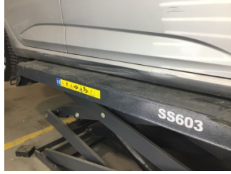
Marşbiyel, sağ, Marşbiyel, sağ > Hasarlı