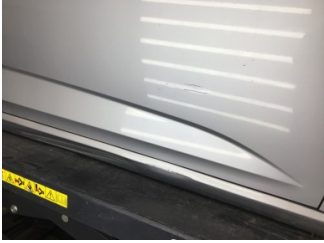
Kapı, sağ ön, Kapı, sağ ön > Çizik