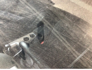
Camlar, Ön cam > Taş izi