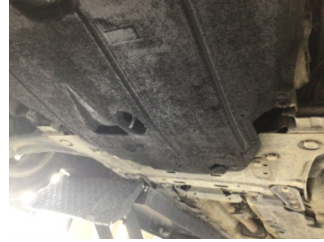
Motor, Alt muhafaza > Deforme Olmuş