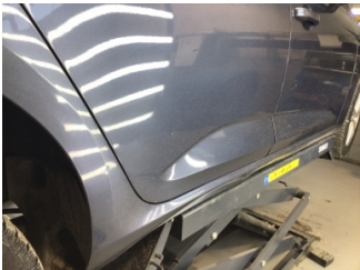
Kapı, sağ arka, Kapı, sağ arka > Noktasal Ezik