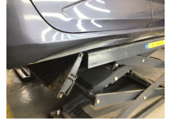
Marşbiyel, sağ, Marşbiyel, sağ > Hasarlı