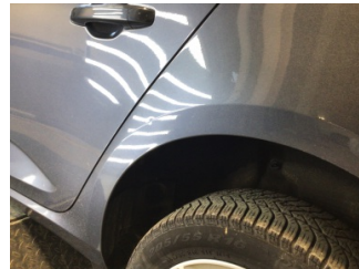
Çamurluk, sol arka, Çamurluk, sol arka > Noktasal Ezik