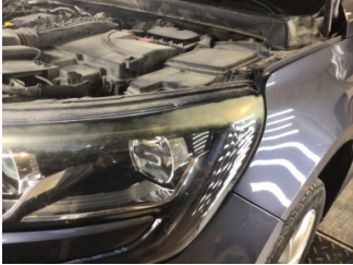
Farlar, Far camı, sol > Solmuş