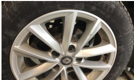
Jant, sağ arka > Çizik