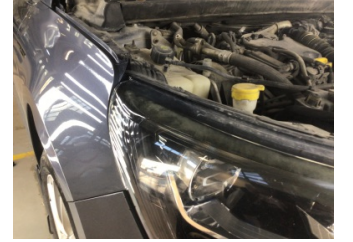
Farlar, Far fitili, sağ > Solmuş