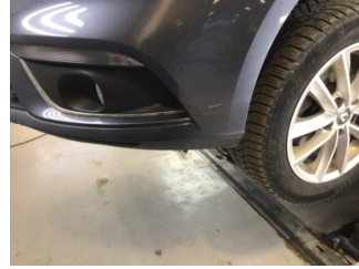
Tampon, ön, Ön tampon > Çizik