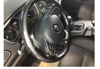
Direksiyon sistemi, Direksiyon simidi > Deforme Olmuş