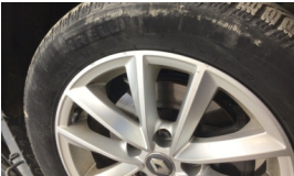
Jant, sağ ön > Çizik