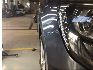
Çamurluk, sağ, Çamurluk, sağ > Hasarlı