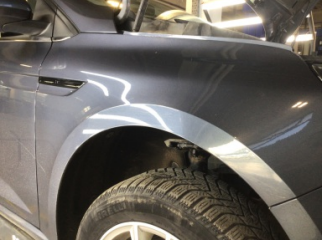
Çamurluk, sağ, Çamurluk, sağ > Çizik