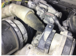
Motor, Turbo hortumları > Yağ Kaçağı