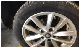
Jant, sol arka > Çizik