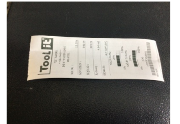
Elektrik donanımı/Pano, Akü > Test Sonucu