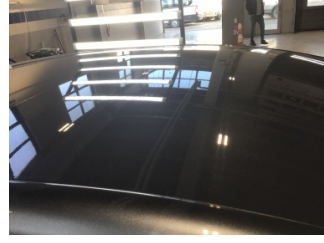
Tavan, Tavan > Yakıcı Madde ile Zarar Görmüş