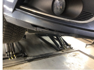
Tampon, ön, Ön tampon > Hasarlı