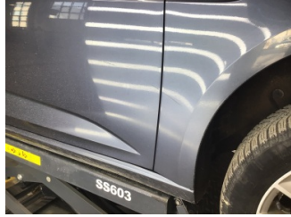
Kapı, sağ ön, Kapı, sağ ön > Çizik