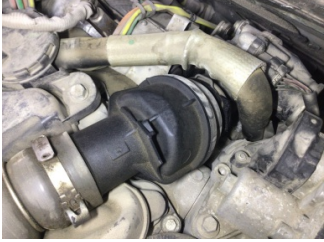
Motor, Turbo > Yağ Kaçağı