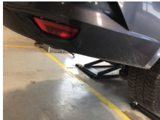
Tampon, arka, Arka tampon > Hasarlı