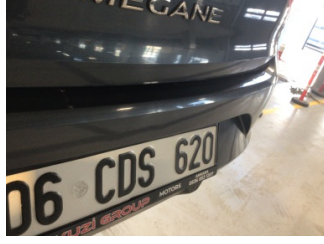
Tampon, arka, Arka tampon > Ezik