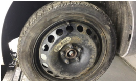
Lastik, sağ ön > Lastik Ebatı Farklı