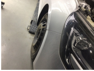
Tampon, ön, Ön tampon > Ayarsız