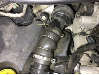
Motor, Turbo hortumları > Yağ Kaçağı