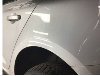
Çamurluk, sol arka, Çamurluk, sol arka > Noktasal Ezik