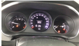
Tekerlek/Lastik > Uyarı Lambası Yanıyor