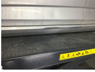
Marşbiyel, sol, Marşbiyel, sol > Ezik