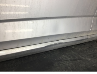
Kapı, sol ön, Kapı, sol ön > Ezik