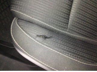
Koltuklar, arka, Arka koltuk > Hasarlı