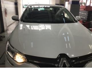
Motor kaputu, Motor kaputu > Ezik