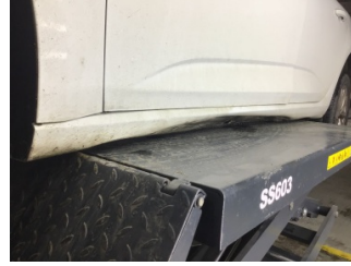
Marşbiyel, sol, Marşbiyel, sol > Hasarlı