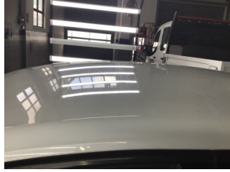
Tavan, Tavan > Noktasal Ezik