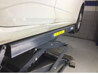
Marşbiyel, sağ, Marşbiyel, sağ > Hasarlı