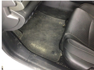
Taban, Taban halısı > Kirlenmiş