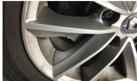
Jant, sol ön > Çizik