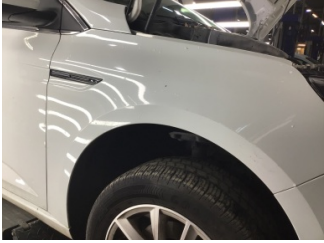
Çamurluk, sağ, Çamurluk, sağ > Çizik