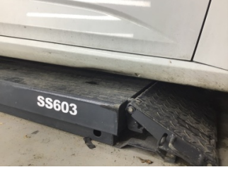
Marşbiyel, sağ, Marşbiyel, sağ > Ezik