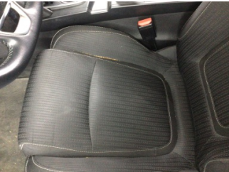
Koltuklar, ön, Koltuk, sol ön > Kirlenmiş