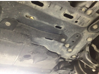
Motor, Alt muhafaza > Hasarlı