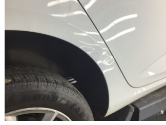
Çamurluk, sağ arka, Çamurluk, sağ arka > Ezik