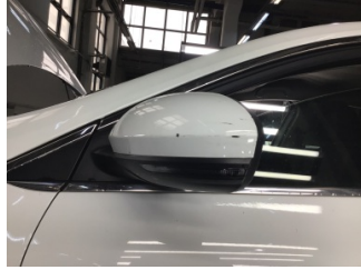
Dikiz aynası, sol, Dış dikiz aynası > Çizik