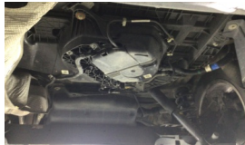
Stepne > Sökülmüş-Yok