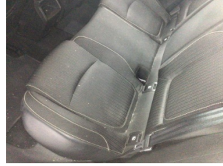
Koltuklar, arka, Arka koltuk > Kirlenmiş