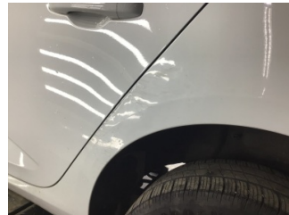
Çamurluk, sol arka, Çamurluk, sol arka > Standart Dışı Onarım