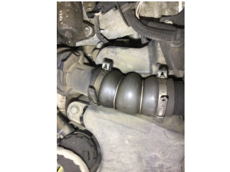
Motor, Turbo hortumları > Yağ Kaçağı