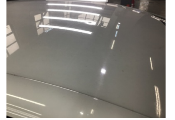
Tavan, Tavan > Noktasal Ezik