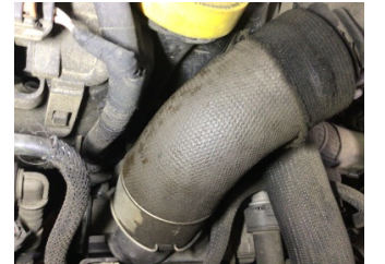
Motor, Turbo hortumları > Yağ Kaçağı