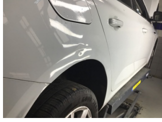
Çamurluk, sağ arka, Çamurluk, sağ arka > Ezik