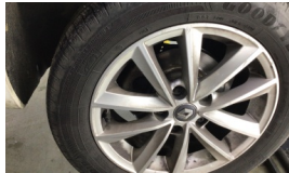
Jant, sağ arka > Çizik