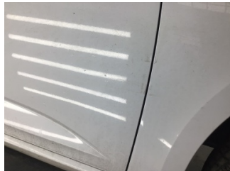
Kapı, sağ ön, Kapı, sağ ön > Noktasal Ezik