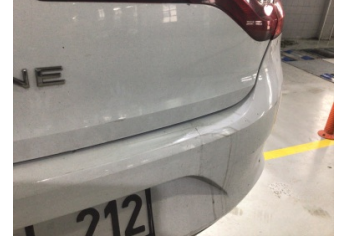
Tampon, arka, Arka tampon > Ezik