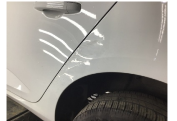
Çamurluk, sol arka, Çamurluk, sol arka > Hasarlı