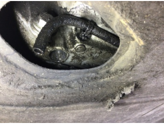
Motor, Yağ karteri > Yağ Kaçağı