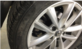
Jant, sağ arka > Çizik