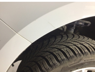
Çamurluk, sol, Çamurluk, sol > Çatlak