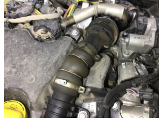
Motor, Turbo hortumları > Yağ Kaçağı