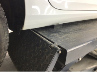
Marşbiyel, sağ, Marşbiyel, sağ > Ezik