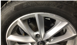
Jant, sol arka > Çizik