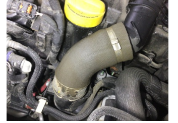
Motor, Turbo hortumları > Yağ Kaçağı