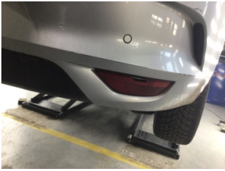
Tampon, arka, Reflektör, sağ > Hasarlı