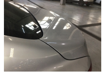
Bagaj kapağı/kapısı, Bagaj kapısı > Noktasal Ezik