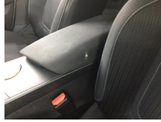
Koltuklar, ön, Kol dayaması > Yakıcı Madde ile Zarar Görmüş