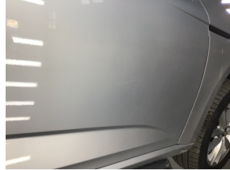
Kapı, sağ ön, Kapı, sağ ön > Çizik