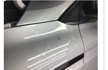
Çamurluk, sol, Çamurluk, sol > Çizik