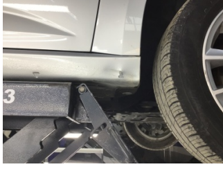
Marşbiyel, sağ, Marşbiyel, sağ > Ezik