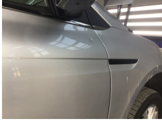
Kapı, sağ ön, Kapı, sağ ön > Noktasal Ezik