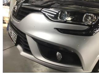
Tampon, ön, Ön tampon > Taş İzi