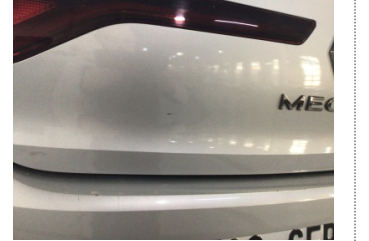
Bagaj kapağı/kapısı, Bagaj kapısı > Çizik