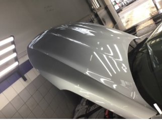
Motor kaputu, Motor kaputu > Ezik