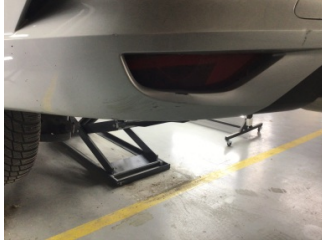
Tampon, arka, Reflektör, sol > Hasarlı