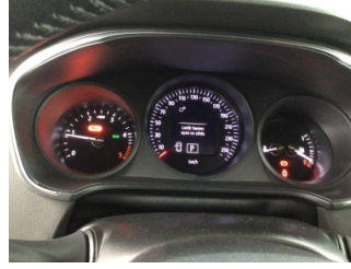
Motor, Bakım > Uyarı Lambası Yanıyor