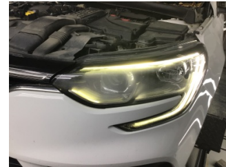
Farlar, Far, sol > Deforme Olmuş