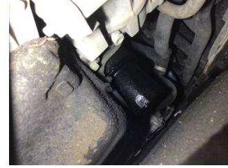
Motor, Yağ filtresi muhafazası > Yağ Kaçağı