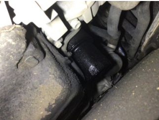
Motor, Yağ filtresi muhafazası > Yağ Kaçağı