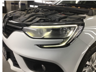
Farlar, Far, sol > Deforme Olmuş