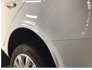
Çamurluk, sol arka, Çamurluk, sol arka > Ezik