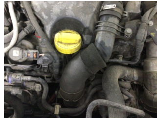
Motor, Turbo hortumları > Yağ Kaçağı