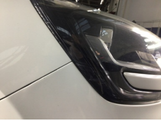
Farlar, Far camı, sağ > Çizik