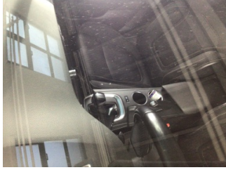
Camlar, Ön cam > Taş izi