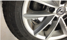
Jant, sol ön > Çizik