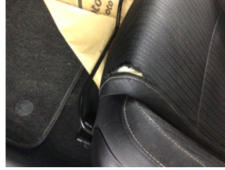
Koltuklar, ön, Koltuk, sol ön > Hasarlı