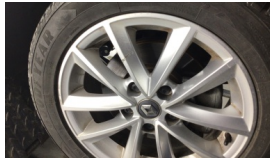
Jant, sağ ön > Çizik