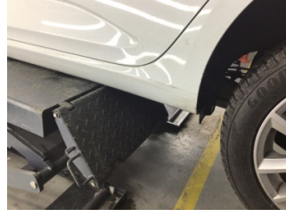
Marşbiyel, sol, Marşbiyel, sol > Ezik