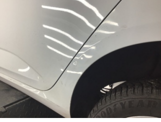
Çamurluk, sol arka, Çamurluk, sol arka > Ezik