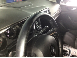
Direksiyon sistemi, Direksiyon simidi > Deforme Olmuş