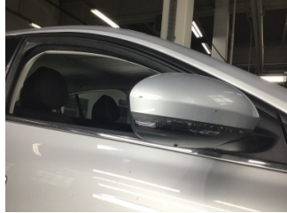
Dikiz aynası, sağ, Dış dikiz aynası > Çizik