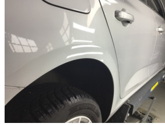
Çamurluk, sağ arka, Çamurluk, sağ arka > Noktasal Ezik