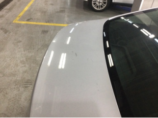
Bagaj kapağı/kapısı, Bagaj kapısı > Çizik