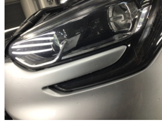
Tampon, ön, Ön tampon > Hatalı Ayarlanmış