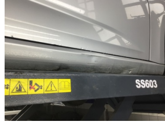
Marşbiyel, sağ, Marşbiyel, sağ > Ezik