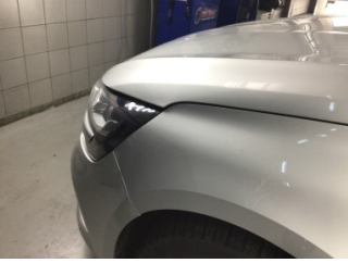
Motor kaputu, Motor kaputu > Ayarsız