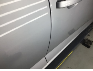
Kapı, sağ ön, Kapı, sağ ön > Ezik