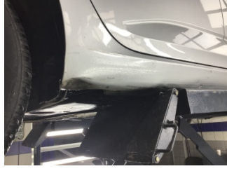
Marşbiyel, sağ, Marşbiyel, sağ > Ezik