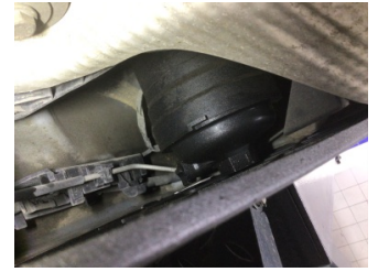
Motor, Yakıt deposu > Sızdırıyor