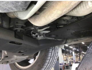
Motor, Yakıt deposu > Sızdırıyor