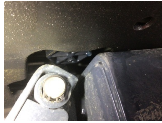
Motor, Yakıt deposu > Sızdırıyor