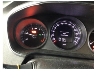
Motor, Motor > Uyarı Lambası Yanıyor