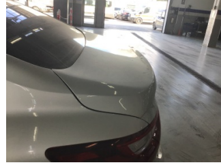
Bagaj kapağı/kapısı, Bagaj kapısı > Dolu Hasarı