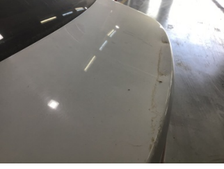
Bagaj kapağı/kapısı, Bagaj kapısı > Ezik