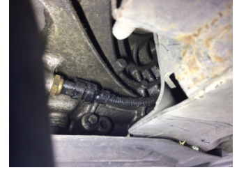
Şanzıman, Şanzıman > Yağ Kaçağı