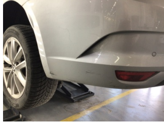
Tampon, arka, Arka tampon > Çizik