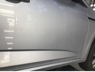
Kapı, sağ ön, Kapı, sağ ön > Çizik