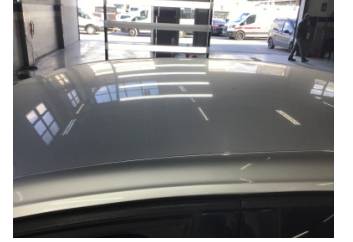
Tavan, Tavan > Dolu Hasarı