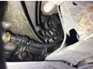
Şanzıman, Kardan mili, ön aks > Yağ Kaçağı