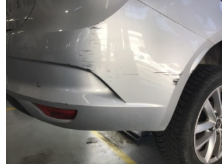
Tampon, arka, Arka tampon > Çizik