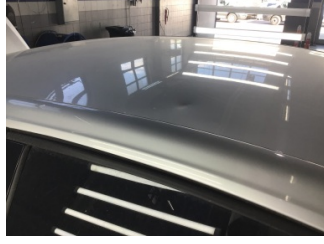
Tavan, Tavan > Ezik