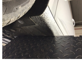
Marşbiyel, sol, Marşbiyel, sol > Ezik