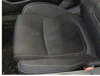
Koltuklar, ön, Koltuk, sağ ön > Kirlenmiş