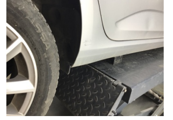
Marşbiyel, sağ, Marşbiyel, sağ > Ezik