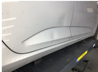
Kapı, sağ arka, Kapı, sağ arka > Hasarlı