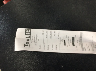
Elektrik donanımı/Pano, Akü > Test Sonucu