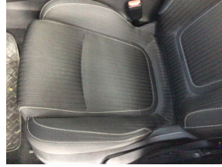
Koltuklar, ön, Koltuk, sol ön > Kirlenmiş