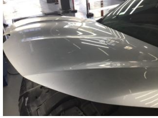
Motor kaputu, Motor kaputu > Dolu Hasarı