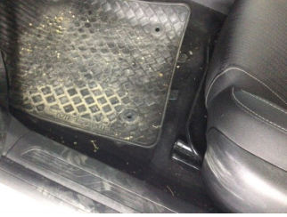
Taban, Taban halısı > Kirlenmiş