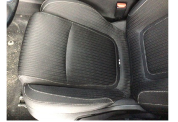
Koltuklar, ön, Koltuk, sol ön > Kirlenmiş