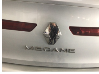
Bagaj kapağı/kapısı, Kilit mekanizması > Hasarlı