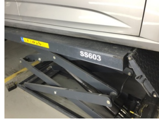
Marşbiyel, sağ, Marşbiyel, sağ > Hasarlı