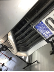
Tampon, ön, Ön tampon ızgarası > Ayarsız