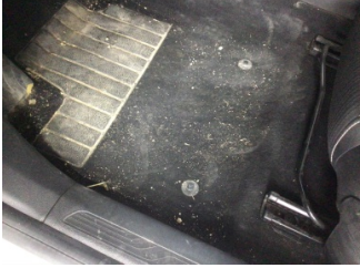
Taban, Paspaslar > Sökülmüş-Yok