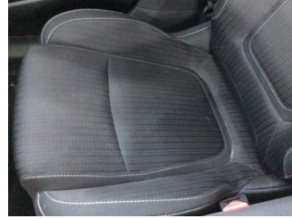
Koltuklar, ön, Koltuk, sağ ön > Kirlenmiş