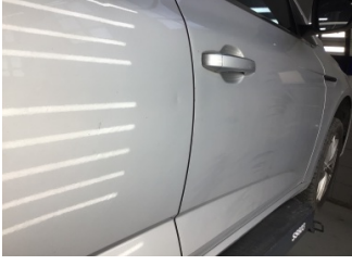
Kapı, sağ arka, Kapı, sağ arka > Ezik