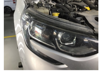
Farlar, Far, sağ > Solmuş