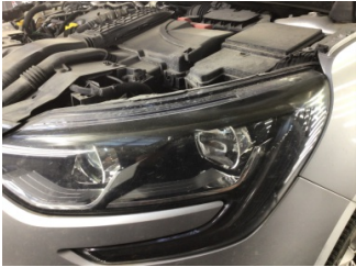
Farlar, Far, sol > Solmuş