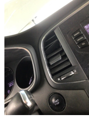
Kalorifer/Klima, Havalandırma ızgarası > Hasarlı