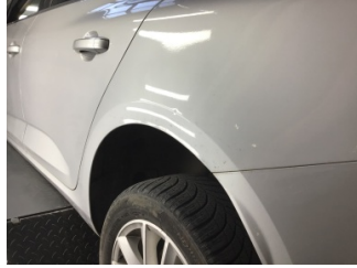
Çamurluk, sol arka, Çamurluk, sol arka > Noktasal Ezik