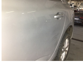
Kapı, sol arka, Kapı, sol arka > Ezik