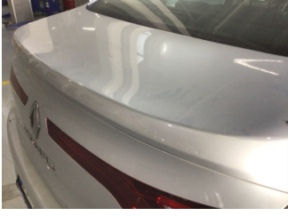
Bagaj kapağı/kapısı, Bagaj kapısı > Noktasal Ezik

Sayfa: 10/11 Araç Çıkış Tarihi: 11.10.2024 15:10