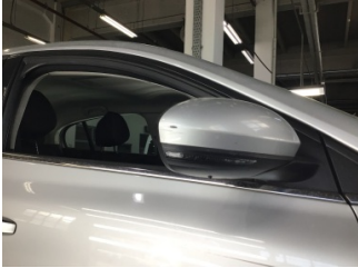
Dikiz aynası, sağ, Dış dikiz aynası > Çizik