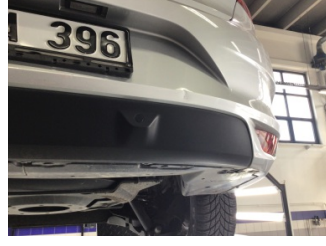
Tampon, arka, Arka tampon > Ezik