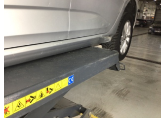
Marşbiyel, sol, Marşbiyel, sol > Hasarlı