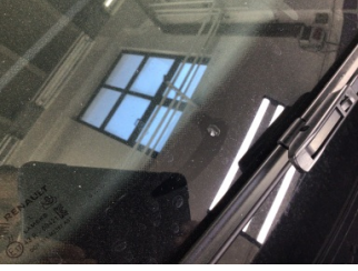
Camlar, Ön cam > Taş Vuruğu