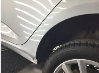
Çamurluk, sol arka, Çamurluk, sol arka > Çizik