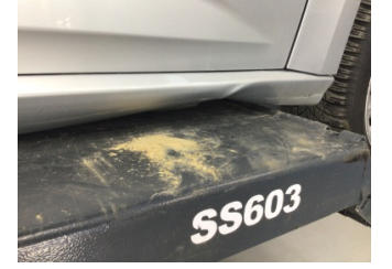
Marşbiyel, sağ, Marşbiyel, sağ > Hasarlı