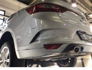
Tampon, arka, Arka tampon > Ezik