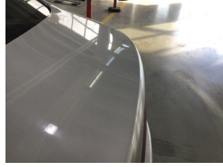
Bagaj kapağı/kapısı, Bagaj kapısı > Noktasal Ezik