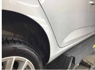
Çamurluk, sağ arka, Çamurluk, sağ arka > Çizik