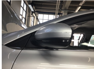
Dikiz aynası, sol, Dış dikiz aynası > Çizik