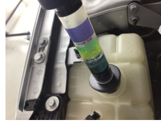
Motor, Silindir kapağı contası > Test Sonucu