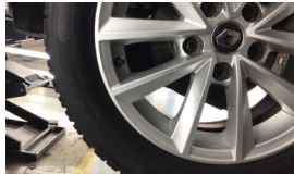
Jant, sol arka > Çizik