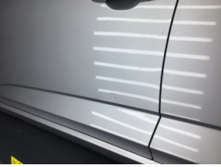
Kapı, sol ön, Kapı, sol ön > Noktasal Ezik