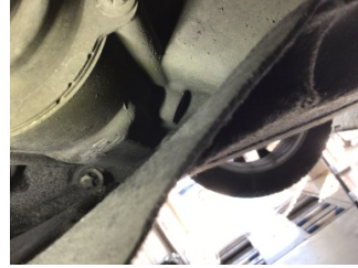
Şanzıman, Şanzıman gövdesi > Çizik