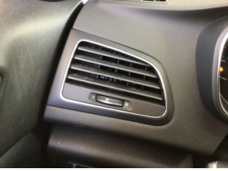
Kalorifer/Klima, Havalandırma ızgarası > Hasarlı