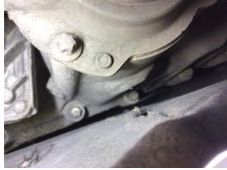
Şanzıman, Şanzıman gövdesi > Çizik