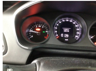
Motor, Bakım > Uyarı Lambası Yanıyor