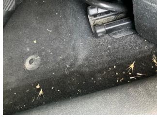
Taban, Taban halısı > Yakıcı Madde ile Zarar Görmüş