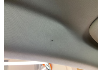
Tavan, Tavan > Yakıcı Madde ile Zarar Görmüş