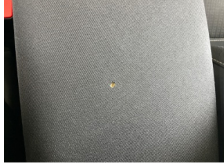
Koltuklar, ön, Kol dayaması > Yakıcı Madde ile Zarar Görmüş