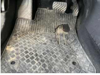
Taban, Paspaslar > Hasarlı