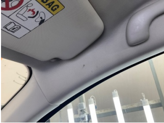
Tavan, Tavan > Yakıcı Madde ile Zarar Görmüş