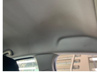
Tavan, Tavan > Kirlenmiş