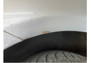
Çamurluk, sol arka, Çamurluk, sol arka > Boyası Atmış