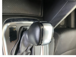
Şanzıman, Vites topuzu > Deforme Olmuş