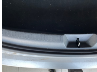
Döşemeler/Kapaklar, Yükleme eşiği kaplaması > Çizik