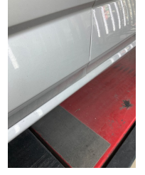
Kapı, sol ön, Kapı, sol ön > Ezik