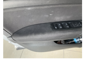
Döşemeler/Kapaklar, Döşemeler/Kapaklar > Deforme Olmuş