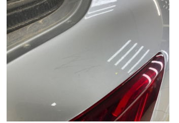
Çamurluk, sağ arka, Çamurluk, sağ arka > Çizik