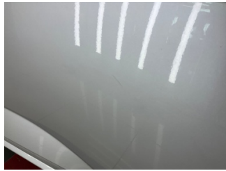
Kapı, sol arka, Kapı, sol arka > Küçük Çizik