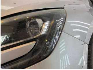
Farlar, Far camı, sol > Çizik