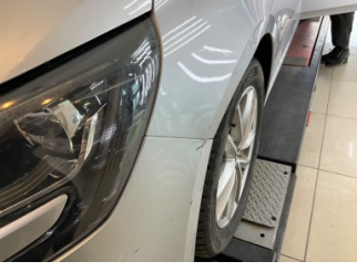
Çamurluk, sol, Çamurluk, sol > Ezik