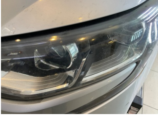
Farlar, Far camı, sol > Deforme Olmuş

Sayfa: 10/11 Araç Çıkış Tarihi: 06.09.2024 15:58