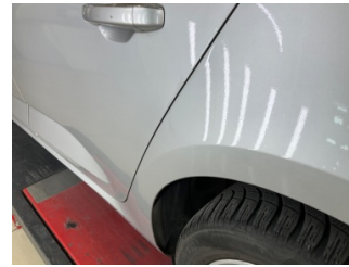
Çamurluk, sol arka, Çamurluk, sol arka > Noktasal Ezik