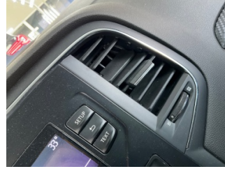
Kalorifer/Klima, Havalandırma ızgarası > Hasarlı