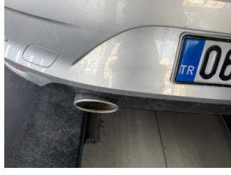
Çamurluk, sol, Amblem > Ezik