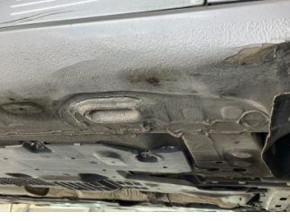
Kaporta, Araç gövdesi altı, ön > Ezik