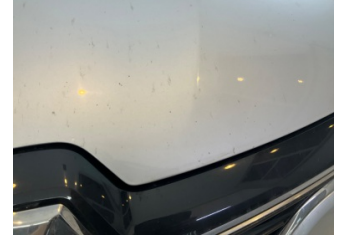
Motor kaputu, Motor kaputu > Taş izi