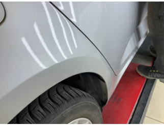
Çamurluk, sağ arka, Çamurluk, sağ arka > Noktasal Ezik