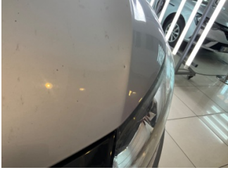
Motor kaputu, Motor kaputu > Noktasal Ezik