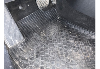
Taban, Paspaslar > Hasarlı