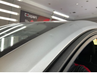
Tavan, Ön cam direği, sol > Noktasal Ezik