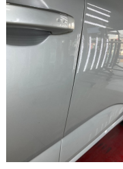
Kapı, sol ön, Kapı, sol ön > Ezik