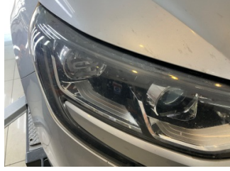
Farlar, Far camı, sağ > Deforme Olmuş