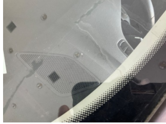
Camlar, Ön cam > Taş izi