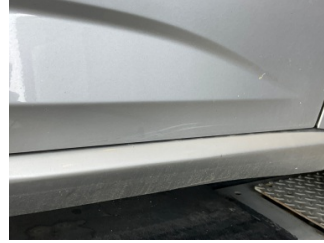
Kapı, sağ ön, Kapı, sağ ön > Çizik