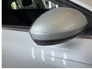
Dikiz aynası, sağ, Dış dikiz aynası kapağı > Çizik