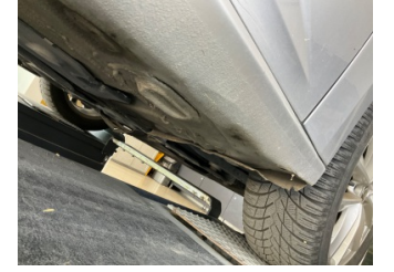
Marşbiyel, sağ, Marşbiyel, sağ > Hasarlı