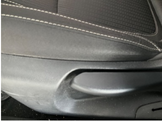
Döşemeler/Kapaklar, Döşemeler/Kapaklar > Deforme Olmuş