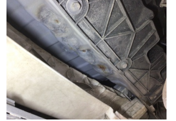
Arka bölüm, Arka sac/panel > Standart Dışı Onarım