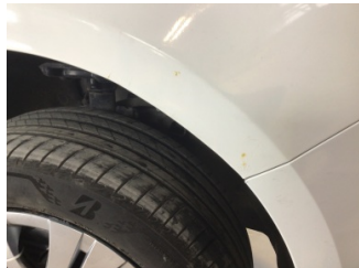
Çamurluk, sağ, Çamurluk, sağ > Pas