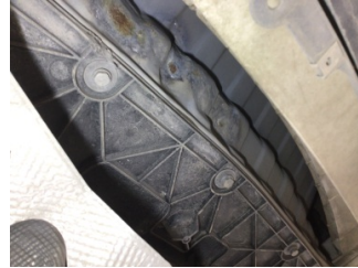
Arka bölüm, İstepne yuvası > Hasarlı