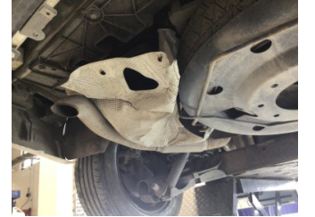
Egzoz sistemi, Susturucu muhafaza sacı arka > Hasarlı