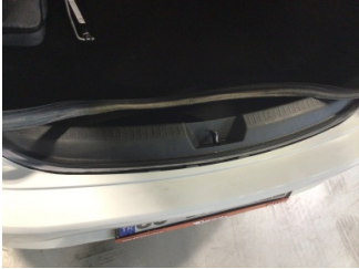
Arka bölüm, Arka sac/panel > Standart Dışı Onarım