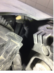
Farlar, Far, sağ > Hasarlı

Sayfa: 10/12 Araç Çıkış Tarihi: 13.02.2025 12:04