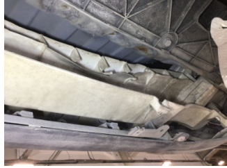
Tampon, arka, Bağlantı ayağı > Hasarlı