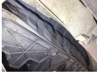
Arka bölüm, Arka sac/panel > Hasarlı