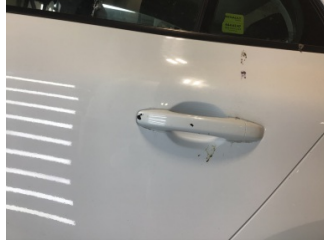
Kapı, sol arka, Kapı kolu, dış > Çizik