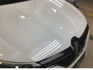
Motor kaputu, Motor kaputu > Taş izi