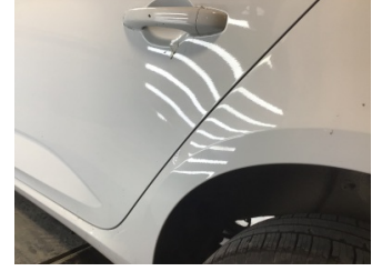
Çamurluk, sol arka, Çamurluk, sol arka > Noktasal Ezik