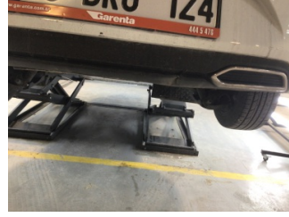
Tampon, arka, Spoiler > Hasarlı