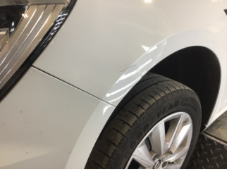
Çamurluk, sol, Çamurluk, sol > Hasarlı