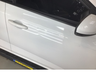
Kapı, sağ ön, Kapı, sağ ön > Ezik