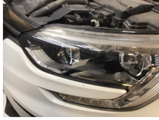
Farlar, Far, sol > Deforme Olmuş