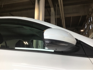
Dikiz aynası, sağ, Dış dikiz aynası > Çizik