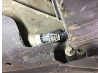
Ön aks, Aks mili, sol > Yağ Kaçığı