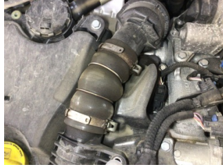
Motor, Turbo hortumları > Yağ Kaçığı