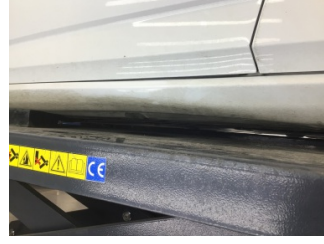
Marşbiyel, sol, Marşbiyel, sol > Ezik