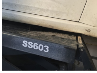
Marşbiyel, sağ, Marşbiyel, sağ > Ezik