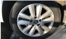
Jant kapağı seti > Hasarlı