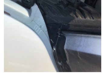
Farlar, Far camı, sağ > Çatlak