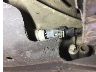
Ön aks, Aks mili, sol > Yağ Kaçığı