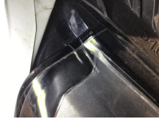
Farlar, Far camı, sağ > Çatlak