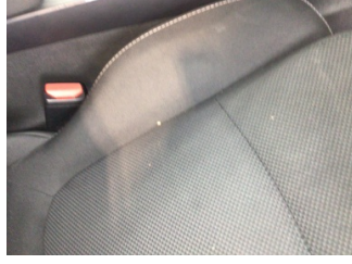
Koltuklar, ön, Koltuk, sağ ön > Yakıcı Madde Ile Zarar Görmüş