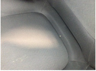
Koltuklar, ön, Koltuk, sol ön > Yakıcı Madde Ile Zarar Görmüş