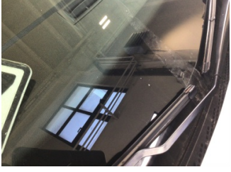
Camlar, Ön cam > Taş Vuruğu

Sayfa: 10/12 Araç Çıkış Tarihi: 08.01.2025 10:15