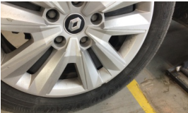
Jant kapağı seti > Hasarlı