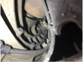
Ön aks, Aks mili, sol > Yağ Kaçığı