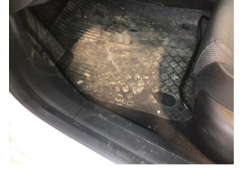
Taban, Paspaslar > Hasarlı