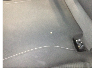
Koltuklar, arka, Arka koltuk > Yakıcı Madde Ile Zarar Görmüş